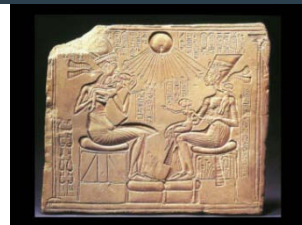
Akhenaton & Nefertiti

Dopo la prima colazione, partenza per Minia (cestino da pranzo), appena l' arrivo si visita "Tel El Amarna" del 1370 A.C. dove ci sono le tombe reali ed i resti del palazzo della famosa Regina Nefertiti (il Palazzo del Nord). cena e pernottamento in albergo.