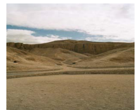
Valley of kings

Dopo la prima colazione, partenza per visitare la Sponda Occidentale di Tebe" Valle dei Re, Valle delle Regine, Madinat Habu dove inclsi costruit dell' Harem ed i resti del palazzo di Ramsete III. pranzo in albergo. P.M. portenza alla stazione ferroviaria e partenza col treno Wagoni Letti per Alessandria, cena e pernottamento.